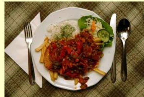
Marhahúsból készült ételek