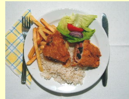
Szárnyashúsból készült ételek