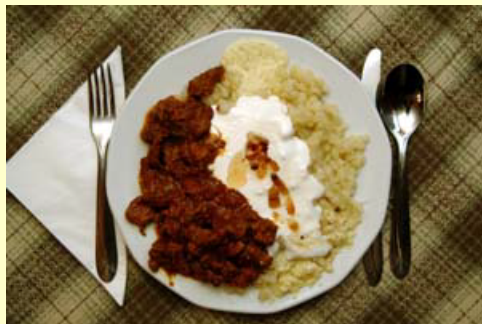
Vadhúsból készült ételek