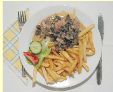
Sertéshúsból készült ételek