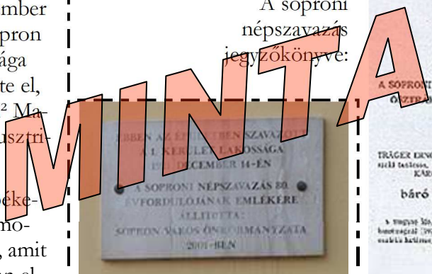
A soproni népszavazás emléktáblája