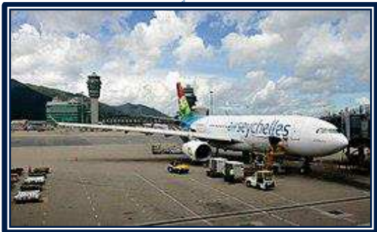
Egy A330-200 az Air Seychelles színeiben (Hongkong, 2013)