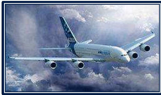
Airbus A380 az Airbus vállalat színeiben