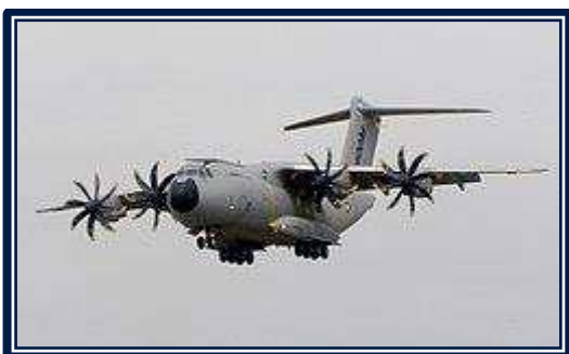
Az A400M második, Grizzly 2 nevű prototípusa 2010-ben