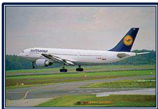
A Lufthansa A300B4-605R repülőgépe leszállás közben