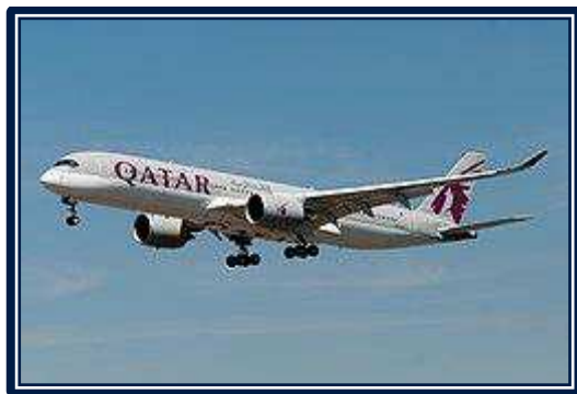
Egy Airbus A350-900 a típust elsőként szolgálatba állító Qatar Airways színeiben