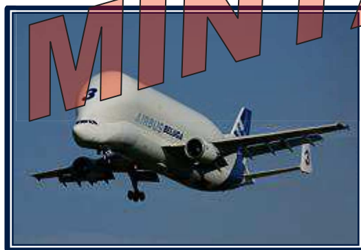
A 3. sz. Airbus Beluga leszállás közben