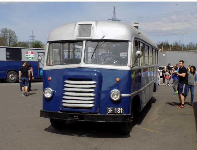
Tr 3,5-ös kisautóbusz